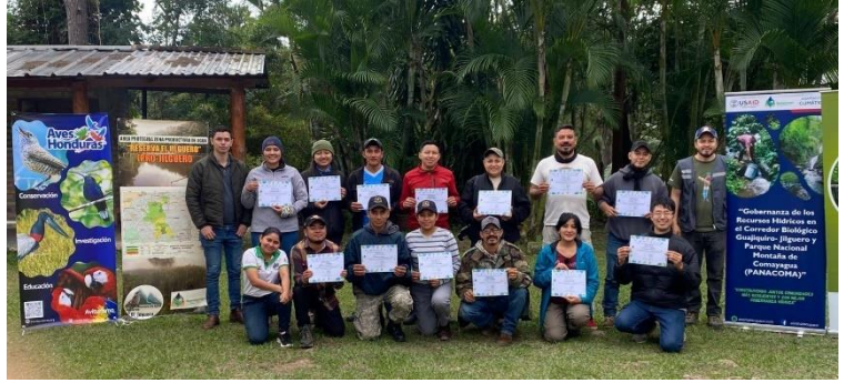
El Club COASL, zona de Marcala y la Sierra Lenca, realizó un conteo de aves en la Zona Productora de Agua El Jilguero, en noviembre 2024.