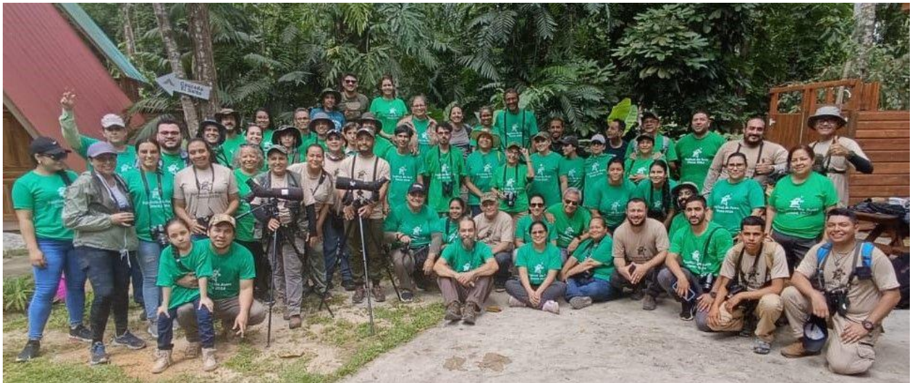
Miembros del COA Oratrix colaboraron como staff del Festival de Omoa, en agosto 2024.