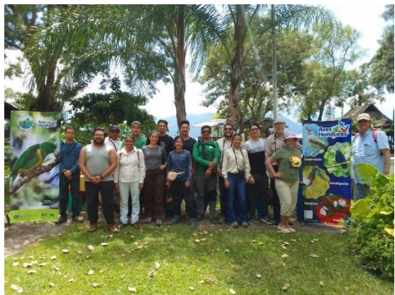
El 1 de septiembre, 2024, 14 miembros de Aves Honduras contabilizaron 311 individuos de Milano Caracolero, o Snail Kite, en las orillas del Lago Yojoa.