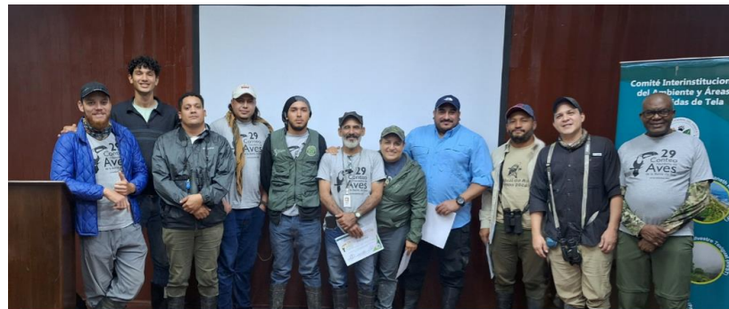
Equipo de guías y personal de apoyo