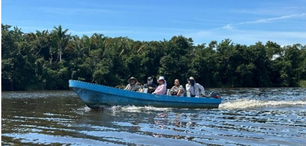
Miembros del COA Cotinga , en la zona de Atlántida, participaron en el Conteo Centroamericano de Aves Acuáticas en febrero, 2024 (arriba), y como guías del Conteo Navideño de la Bahía de Tela en diciembre (abajo).