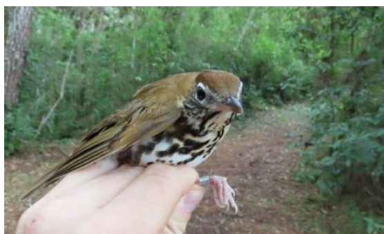
Zorzalito Pecho Manchado, o Wood Thrush, es una de las especies capturadas y anilladas en su pata, durante un estudio de variación poblacional de aves terrestres en la Reserva Biológica Uyuca.