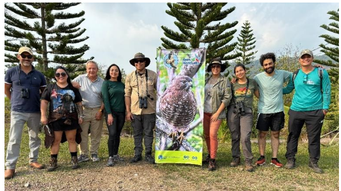
El COA Alzacuanes, zona de Tegucigalpa, visitó la Hacienda Guacerique, Distrito Central Metropolitano en abril, 2024 (izquierda) y celebró Global Big Day con una exploración en San Marcos de Colón, departamento de Choluteca, en mayo 2024 (derecha).