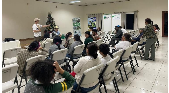
El COAS Copán, zona de Santa Rosa de Copán, y el COASMO, zona de San Marcos de Ocotepeque, colaboraron para realizar un conteo navideño en la región de El Trifinio, occidente de Honduras, en diciembre, 2024.