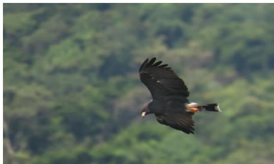
Un macho adulto de Milano Caracolero, o Snail Kite, durante el proyecto de monitoreo de 2024.