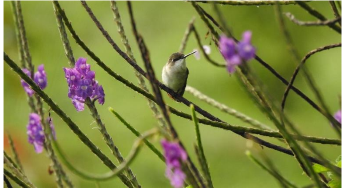
El COA Siguatepeque ofreció un programa para los participantes del Festival de las Flores, en octubre 2024.