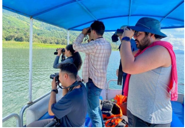
El COA Clorofonias, zona de Lago Yojoa, colaboraron en el conteo del Milano Caracolero en agosto, 2024.