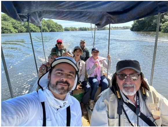
El COA Zorzales, en la zona de San Pedro Sula, participó en el Conteo Centroamericano de Aves Acuáticas en febrero 2024, y realizó sus elecciones de coordinación en septiembre 2024.